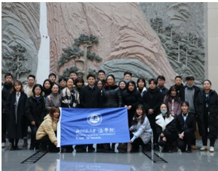
法学院学生代表参观最高人民法院

学院现有专任教师 93 人，其中教授 47 人，副教授 34 人，20% 以上的教师具有海外高水平大学博士学位。此外，学院还聘请了来自全国人大常委会、最高人民法院、最高人民检察院等实务部门以及剑桥大学、牛津大学、北京大学、清华大学、中国社科院等国内外一流大学和学术机构的百余名知名专家学者担任特聘教授和兼职教授。2019 年，我院特聘教授高铭暄先生获得“人民教育家”国家荣誉称号。